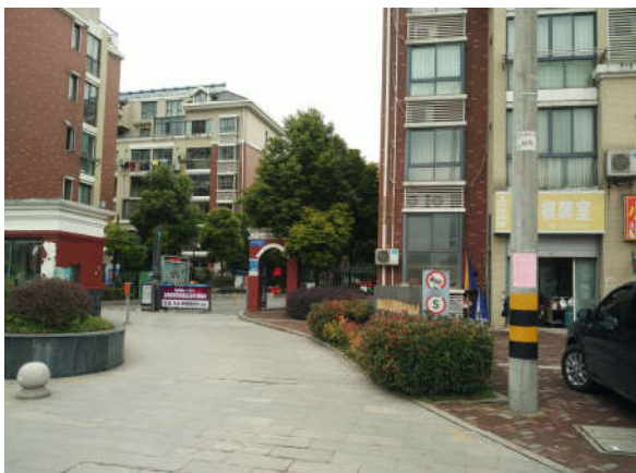
西郡 188 花园公示图